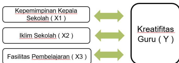
Gambar 1 Kerangka Model Hubungan Antar Variabel

hubungan antar variabel, dapat dilihat pada gambar 1