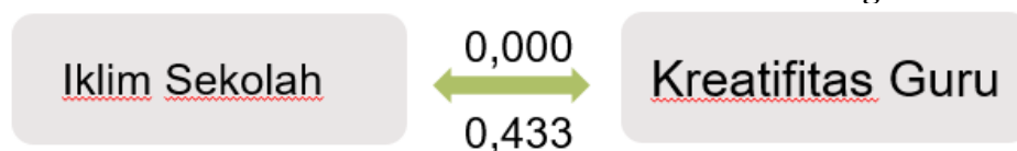
Gambar 8. Hasil Korelasi antara X_2 dengan Y

Sesuai dengan nilai koefisien korelasi rhitung tersebut dapat disimpulkan bahwa pedoman derajat hubungan antara iklim sekolah dengan kreativitas guru sebagai tenaga pendidik masuk dalam ketagori hubungan kuat. Sesuai dengan hasil penelitian Putri (2015) yang menyatakan bahwa antara iklim kerja dengan kreativitas guru terdapat hubungan positif dan signifikan. Kemudian hasil penelitian Ghifar, dkk, (2019) juga menyatakan terdapat hubungan positif yang cukup kuat iklim organisasi dengan kreativitas guru. Pernyataan tersebut diperkuat lagi oleh hasil penelitian Terry, dkk, (2018) dalam 1 st International Conference on Social Sciences (ICSS) menunjukkan bahwa “iklim sekolah mempunyai dampak positif dengan kreativitas guru”. Jadi iklim sekolah merupakan salah satu faktor yang memiliki hubungan langsung terhadap kreativitas guru sebagai tenaga pendidik di sekolah.