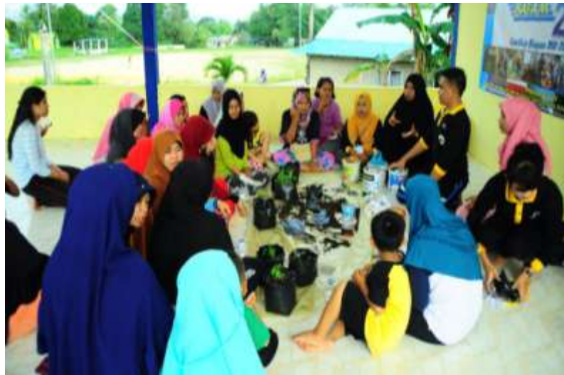
Figur 2. Proses pelatihan penyiapan media tanam dan penanaman bibit