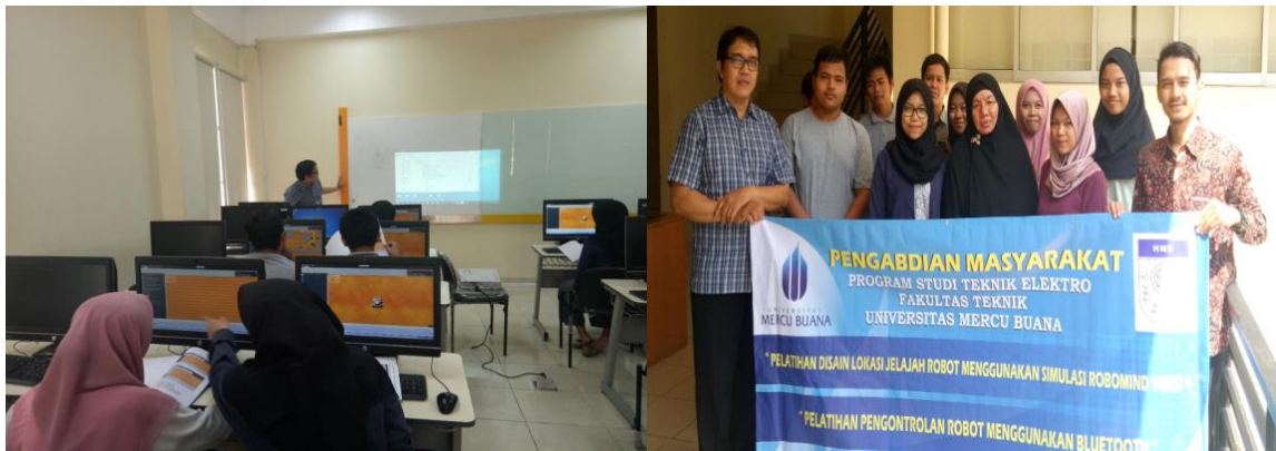
Figur 3. Proses Pembelajaran dan Simulasi Robot UMB

Simulasi pemrograman dengan robot dilakukan pada map area yang dapat dipilih dan bervariasi, sehingga tidak membosankan. Robot dapat diprogram untuk mengecat, line follower, dan memindahkan benda, tergantung kreatifitas pemrograman yang dilakukan.