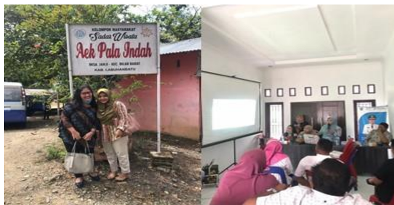
Figur 3. Kegiatan Sosialisasi dengan Masyarakat

Kegiatan promosi wisata alir Sungai Aek Pala saat ini masih belum dilaksanakan secara maksimal. Saat tim pengabdian melakukan kunjungan di lokasi wisata alir sungai Aek Pala belum ada papan pintu masuk ataupun spanduk dalam mempromosikan wisata kawasan alir sungai Aek Pala. Tim pengabdian hanya menjumpai promosi saat membaca berita di sebuah portal berita online yang memuat tentang keunikan alir sungai Aek Pala serta upload foto wisatawan yang diunggah ke media sosial. Tim pengabdian melaksanakan sesi wawancara dengan pengunjung, hanya mengetahui kawasan wisata alir sungai Aek Pala dari sanak saudara dan teman serta postingan pada halaman media sosial, sehingga dapat dikatakan media sosial merupakan strategi utama dalam mengenalkan serta mempromosikan wisata alir sungai Aek Pala kepada masyarakat ramai.