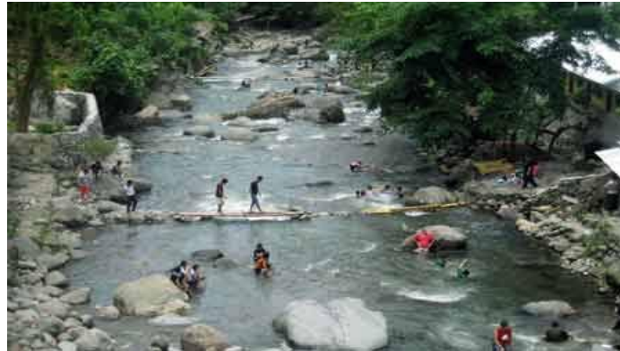
Figur 3. Lokasi Wisata Alam Pemandian Aek Pala

kunjungan ke lapangan masyarakat sekitar masih sebatas membuat usaha berjualan makanan ataupun minuman kepada pengunjung kawasan wisata alir sungai.