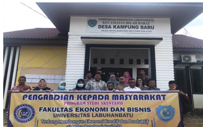
Figur 2. Lokasi Pengabdian Pelaksanaan PKM

Kecamatan Bilah Barat berada di Kabupaten Labuhanbatu, Sumatera Utara dimana pada kecamatan ini terdapat pemandangan alam, yaitu Aek Pala. Kawasan wisata ini masih tergolong baru karena alir sungai Aek Pala masih kurang sarana dan prasarana sebagai penunjang untuk destinasi wisata. Dengan adanya sarana yang lengkap menjadikan potensi aliran sungai Aek Pala bermanfaat bagi masyarakat desa jika dikelola serta dikembangkan dengan optimal. Pada akses jalan menuju tempat wisata dari aliran Sungai cukup mudah dengan kondisi jalan yang diaspal sehingga petunjuk arah lokasi kawasannya hanya terdapat ketika sudah memasuki wilayah Desa Janji akibatnya banyak pengunjung yang bingung bahkan baru pertama kali berkunjung kesana dan dari luar daerah. Menuju kawasan wisata sungai Aek Pala tidak terdapat transportasi umum, sehingga bagi yang menggunakan kendaraan pribadi disarankan menuju kawasan wisata Sungai dapat dilalui oleh kendaraan roda dua maupun roda empat.