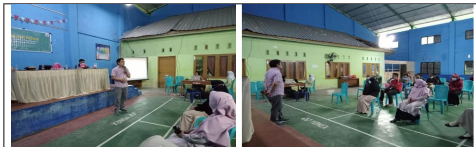
Figur 3. Kegiatan FGD Pengembangan BUMDES

Tahap kedua dalam pengabdian masyarakat ini dilaksanakan kegiatan Focus Group Discussion Pengembangan Badan Usaha Milik Desa, untuk lebih jelasnya dapat dilihat pada gambar berikut ini.