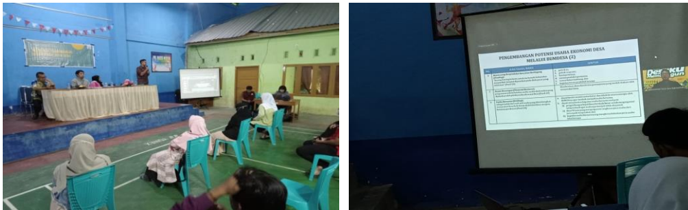
Figur 2. Kegiatan Workshop BUMDES dengan Materi Potensi Ekonomi, Aturan Pengelolaan BUMDES, dan Sukses Story BUMDES