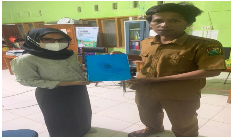
Figur 4. Penyerahan Dokumen Analisis Pengembangan BUMDES Kepada Pemerintah Desa Pamboborang. Tanggal 22 Desember 2021 di Kantor Desa

kesiapan pemerintah desa untuk menindaklanjuti beberapa Rekomendasi yang telah kami berikan terutama dalam hal Pendampingan proses registrasi dan sertifikasi Badan Hukum BUMDES.