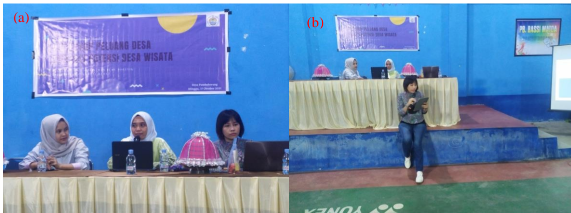
Figur 2. Kegiatan Workshop Potensi Desa Wisata Oleh Dua Narasumber di Aula Desa Pamboborang: (a). Penyampaian Materi Aturan Desa Wisata, dan (b). Penyampaian Materi Peranan Pemuda Dalam Peningkatan Desa Wisata

Jika potensi desa dapat dikembangkan dan dikelola dengan baik maka peningkatan kesejahteraan masyarakat desa Pamboborang akan tercapai. Selain itu faktor pendukung yaitu masyarakat desa dan pemerintah desa yang sangat penting untuk kemajuan desa. Sementara itu yang dapat menghambat pengembangan desa adalah adanya konflik kepentingan antar anggota masyarakat dan pemerintah desa, kurangnya publikasi yang dilakukan oleh masyarakat Desa Pamboborang sehingga potensi wisata yang ada tidak diketahui oleh masyarakat lain yang menyebabkan kurangnya kunjungan wisata ke Desa Pamboborang, serta belum ada fasilitas sarana dan prasarana di titik lokasi wisata.