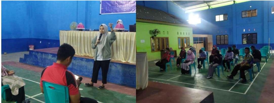
Figur 4. Kegiatan Focus Group Discussion yang Dipandu oleh Salah Satu Pengabdian pada Kegiatan Ini.