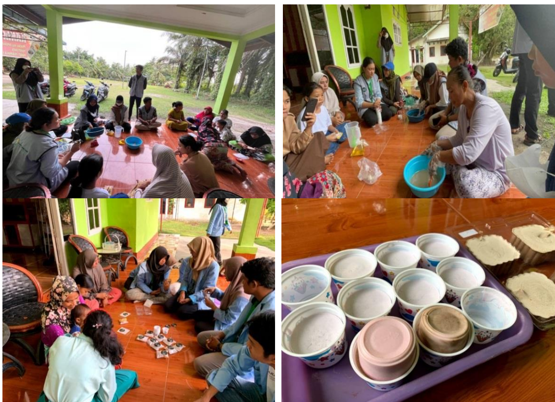
Figur 2. Pelaksanaan pelatihan pembuatan sabun organik dengan warga

Berdasarkan kuisisioner yang telah diisi sebelum kegiatan dilaksanakan dapat disimpulkan bahwa seluruh masyarakat mengetahui jenis produk pembersih dan umumnya menggunakan sabun yang mempunyai merek didalam kehidupan sehari-hari. Belum ada dari masyarakat yang membuat sabun sendiri untuk memenuhi kebutuhan sehari-hari. Dari 10 orang yang mengisi kuisisioner hanya 1 orang yang pernah mendapatkan penyuluhan tentang pembuatan sabun dan 2 orang yang mengetahui bahwa sabun dapat dibuat dengan memanfaatkan minyak kelapa. Maka dari itu, masih sangat dibutuhkan edukasi oleh masyarakat untuk semakin menambah pengetahuan ataupun wawasan tentang sabun yang sering digunakan dalam kehidupan sehari-hari baik itu mulai dari bahan pembuatannya hingga proses yang dilakukan untuk membuat sabun tersebut. Pelaksanaan pengabdian kepada masyarakat tentang pembuatan sabun berbahan minyak kelapa organik sangat diminati dan antusias warga, seperti pada Figur 2.