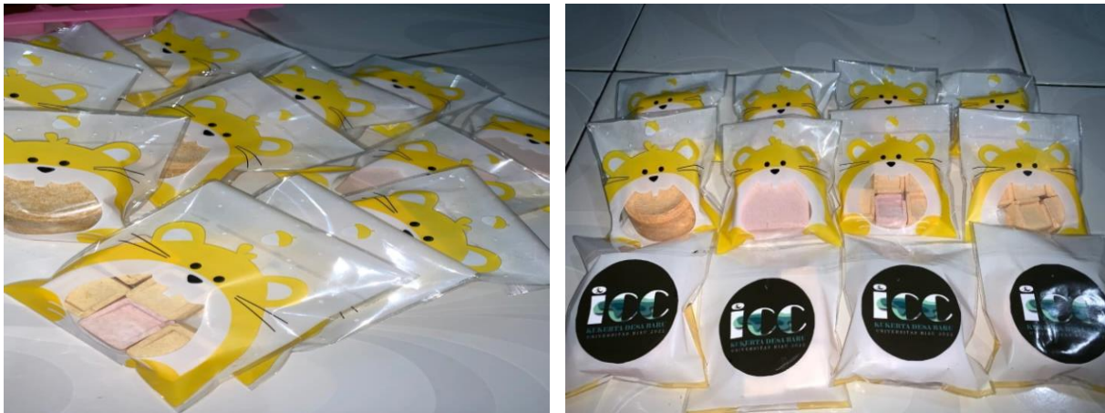
Figur 3. Sabun Hasil Praktek dan Pengemasan