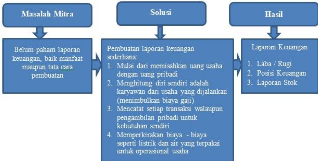
Figur 1. Metode Pelaksanaan PKM

pembuatan laporan keuangan sederhana mulai dari pencatatan transaksi dan penyusunan laporan keuangan.