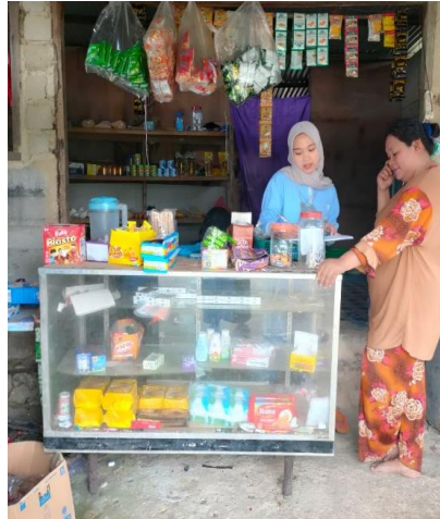
Figur 2. Kegiatan Pendampingan

memberikan pelatihan penyusunan laporan keuangan sederhana. Kegiatan telah dilaksanakan secara offline pada hari Sabtu dan Minggu tanggal 17 sd 18 September 2022 dan tanggal 24 sd 25 September 2022.