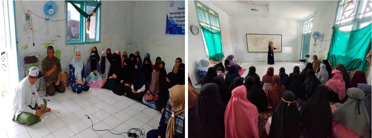
Figur 2. Kegiatan Sosialisasi Kewirausahaan

kegiatan tersebut melibatkan sekitar 30 santriwati dan didampingi oleh jajaran Pengurus Pondok Pesantren. Dokumentasi kegiatan pengabdian dapat dilihat pada gambar di bawah ini :