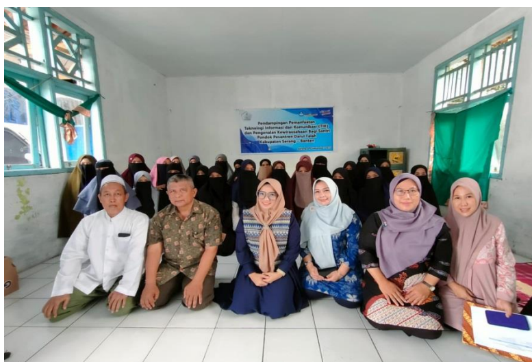
Figur 3. Tim Pengabdian dengan Peserta

Tim pelaksana pengabdian memberikan materi dan penjelasan tentang kewirausahaan, memperkenalkan konsep kewirausahaan kepada peserta, dan memberikan motivasi melalui ceramah. Dalam pendahuluan, bagaimana rencana bisnis ( Business Plan ) dan berbagai jenis peluang bisnis, termasuk peluang bisnis yang tidak bermodal antara lain : Dengan menggunakan contoh wirausahawan sukses di usia muda, Reseller , Justip dan Afiliasi akan berbagi melalui multimedia, manfaat berwirausaha, peluang wirausaha yang memotivasi penggunaan waktu luang mereka, dan wirausahawan sukses, serta memberikan pengetahuan umum tentang langkah-langkahnya.