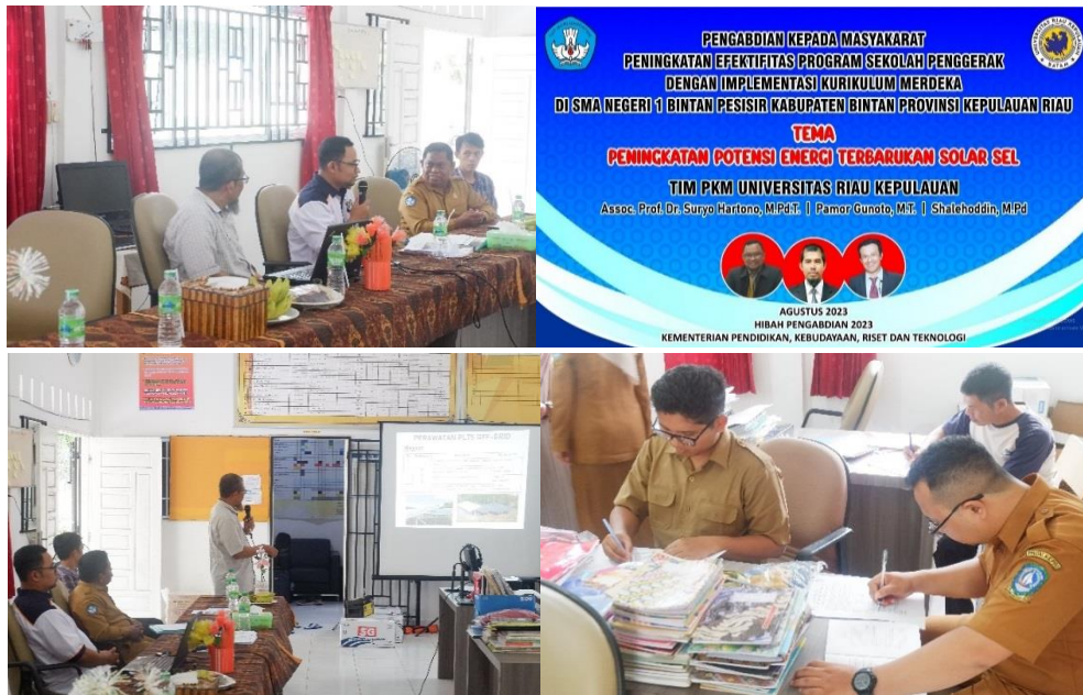
Figur 6. Pelatihan Pengelolaan dan Perawatan Panel Surya Pada Mitra