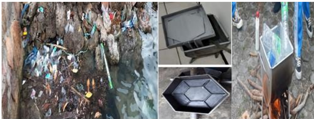
Figur 3. Ilustrasi pengelolaan sampah plastik daerah pantai untuk paving blok

bahan konstruksi (paving blok), (Kader et al., 2021; Putra dan Yuriandala, 2010). Pengelolaan limbah plastik menjadi pilihan karena potensi pengelolaan limbah tersebut belum dilakukan dengan baik. Sementara dengan cara pengelolaan ini akan memberikan dampak pada lingkungan berupa pengurangan limbah plastik. Paving blok dengan model heksagonal dalam satu meter menggunakan 27 Pcs, setiap satu paving blok membutuhkan sekitar 3-5 kg sampah plastik. Jadi, dengan satu meter persegi tersebut telah menyingkirkan 10-20 kg sampah plastik dari lingkungan, (Putra dan Yuriandala, 2010). Kebermanfaatan akan hasil proyek dapat digunakan secara langsung disekitar mitra. Kegiatan ini dikoordinatori oleh ketua tim, 2 anggota dan 2 mahasiswa.