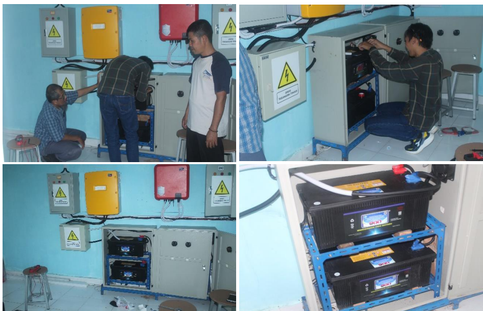
Figur 5. Instalasi Baterai Panel Surya oleh Tim PKM

Kegiatan perakitan baterai panel surya dilaksanakan pada 29 Agustus 2023. Perakitan baterai panel surya dilakukan langsung oleh anggota tim PKM, dengan dibantu oleh mahasiswa dan tendik yang diamanahkan sebagai teknisi mitra. Penggantian baterai dilakukan sebagai upaya yang paling maksimal untuk mengurangi anggaran operasional, mengingat pergantian baterai yang sesuai dengan spesifikasi yang diberikan vendor perakitan panel surya tidak rasional, terlalu mahal dan akan menyulitkan operasional mitra. Perakitan dilaksanakan sesuai rencana dan telah dilakukan proses uji coba secara langsung penggunaan panel surya dengan baterai yang diganti oleh tim PKM. Panel surya dapat berfungsi dengan baik tanpa kendala, seluruh beban listrik yang dihubungkan dengan panel surya dapat beroperasi dengan baik.