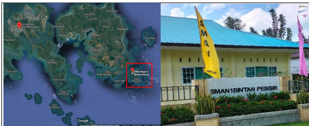
Figur 1. Peta Lokasi Kegiatan dan Mitra PKM

Kegiatan ini bertempat di SMAN 1 Bintang Pesisir, terletak di Pulau Gin besar, Kampung Pedes, Desa Numbing, Kecamatan Bintang Pesisir, Kabupaten Bintang, Provinsi Kepulauan Riau. Jarak Pergutuaan Tinggi (PT) dengan Mitra adalah 121 KM, melalui perjalanan darat dan laut. Lingkungan mitra berada pada daerah kepulauan dengan lingkungan pesisir dan perkebunan karet, yang saat ini kurang produktif.