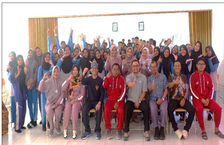
Figur 8. Foto Bersama Mitra Setelah Kegiatan PKM

Berdasarkan kegiatan yang telah dilaksanakan kepada mitra terhadap aspek permasalahan yang terjadi, maka didapatkan hasil kegiatan: 1). Terdapat peningkatan pengetahuan untuk pemeliharaan dan perawatan oleh pendidik dan tenaga kependidikan sebagai sumber daya utama dalam mengelola pembangkit listrik tenaga surya, 2). Pergantian suku cadang baterai dilaksanakan dengan baik sesuai dengan kebutuhan mitra, uji coba suku cadang baterai dilakukan dengan hasil yang maksimal, dapat berfungsi dengan baik dan tanpa kendala. Pergantian suku cadang yang tepat akan mendukung proses operasional pembangkit listrik tenaga surya dengan optimal. Pembangkit listrik tenaga surya menjadi sarana vital dalam mendukung intervensi program sekolah penggerak terutama pada peran digitalisasi. 3) Terwujudnya produk paving blok dari limbah plastik yang sesuai dengan harapan.