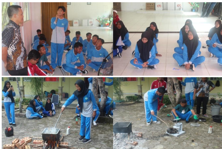
Figur 7. Pelatihan Pengelolaan Sampah Plastik dan Pembuatan Paving Blok

Kegiatan selanjutnya adalah kegiatan pelatihan dan work shop untuk mengelola sampah plastik menjadi paving blok. Kegiatan ini dilaksanakan pada tanggal 30 Agustus 2023. Berdasarkan identifikasi dan karakteristik lingkungan sekolah mitra yang berada di lingkungan kepulauan atau pesisir, banyak ditemukan sampah plastik yang mengganggu lingkungan, maka diperlukan tindakan untuk meminimalisir keberadaan sampah plastik tersebut untuk mengurangi polusi limbah plastik dilingkungan sekitar, (Sudarno, 2021).