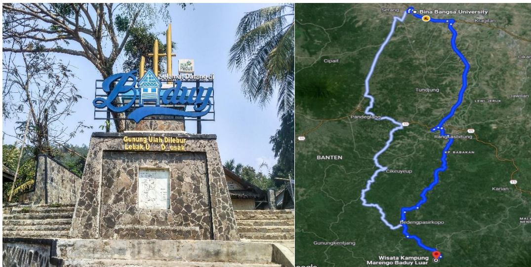
Figur 1. Peta Lokasi Kegiatan

Kegiatan pengabdian ini dilakukan di Kampung Baduy yang berada di desa Kanekes, Kecamatan Luwidamar, Kabupaten Lebak. Jarak tempuh perjalanan dari kampus Universitas Bina Bangsa ke kampung Baduy 2 jam 11 menit melalui jalur darat. Berikut Figur 1 peta lokasi kegiatan pengabdian.