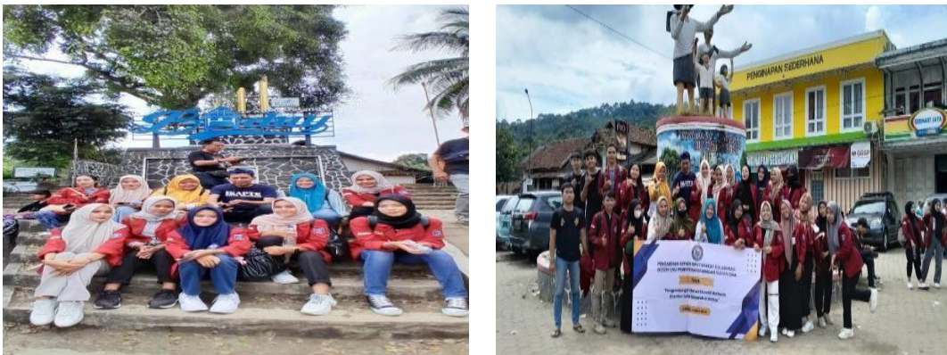
Figur.5 Dokumentasi Kegiatan Baduy

Berdasarkan kegiatan yang telah dilaksanakan berkaitan dengan aspek permasalahan yang terjadi, maka didapatkan hasil kegiatan, yaitu peningkatan pengetahuan para pengrajin tenun masyarakat Baduy terkait alternatif bahan baku kain tenun dan memasarkan produk kerajinan tenun melalui berbagai platform marketplace .