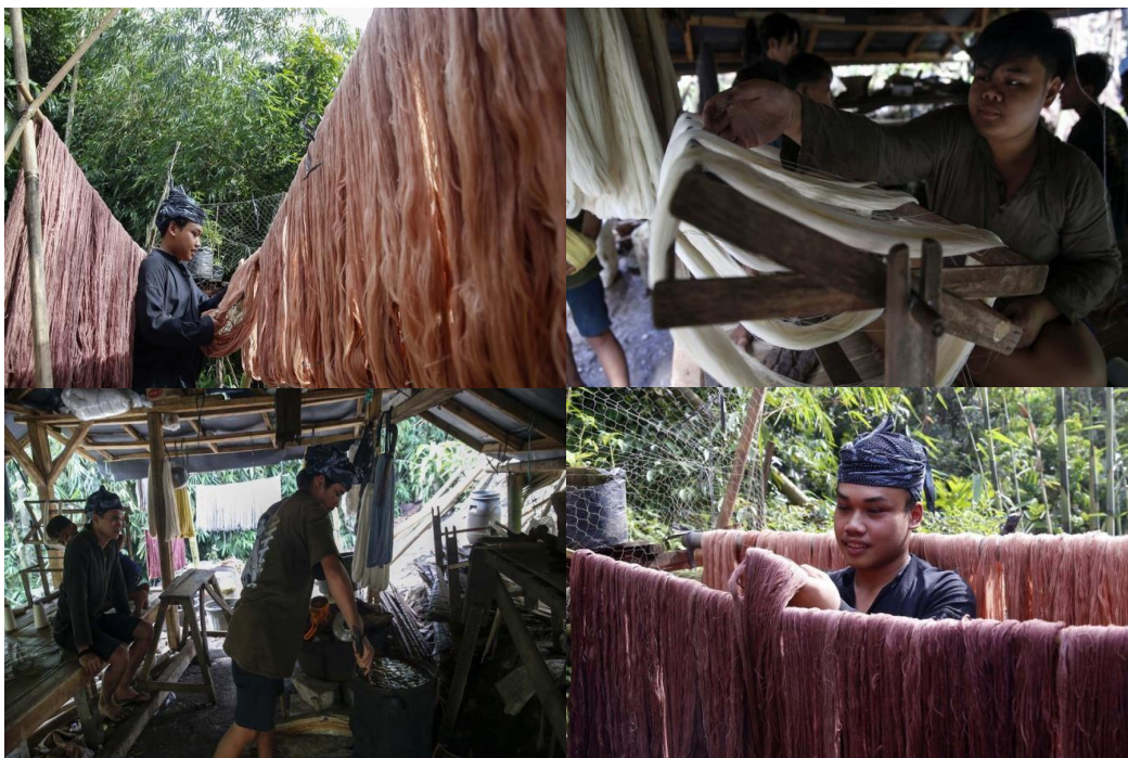
Figur 3. Proses Pembuatan Benang dari Pohon Mahoni

Kulit mahoni memiliki sifat antibakteri yang dapat membantu mencegah pertumbuhan bakteri pada kain. Hal ini dapat membuat kain lebih tahan lama dan terhindar dari bau apek. Kulit mahoni juga memiliki sifat antijamur yang dapat membantu mencegah pertumbuhan jamur pada kain. Hal ini dapat membuat kain lebih tahan lama dan terhindar dari noda jamur. Kulit mahoni dapat membantu meningkatkan daya tahan kain terhadap kerusakan akibat sinar UV dan abrasi. Hal ini dapat membuat kain lebih tahan lama dan tidak mudah pudar. Selain itu, kulit mahoni dapat membantu melembutkan kain dan membuatnya lebih nyaman dipakai.