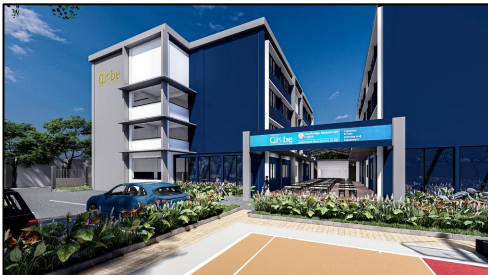
Figur 1. Foto Bangunan SGNP Batam

Pengabdian Kepada Masyarakat (PKM) berbentuk pelatihan secara campuran untuk meningkatkan pemahaman dan kompetensi guru dalam menyusun modul ajar yang dilakukan selama 1 tahun sejak bulan Agustus 2023 sampai saat ini sesuai dengan tahapan yang ditetapkan. Peserta dalam kegiatan PKM ini adalah sebanyak 79 guru yang berasal dari SGNP 1, 2, dan 3 Batam. Jarak tempuh SGNP 1 Batam dengan UNRIKA. Berikut di bawah ini foto Sekolah Globe National Plus Batam