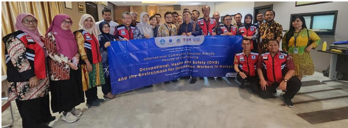
Figur 2. Participants of the Event

Figur 3, menunjukkan presentasi dosen Teknik Elektro Universitas Mercu Buana yang mengangkat topik K3 di bidang Listrik Rumah Tangga dan kegiatan audiensi antara dosen dan peserta terhadap materi yang disampaikan.