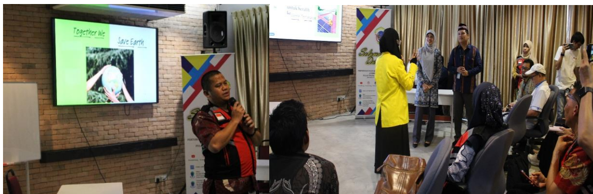
Figur 3. Pemaparan keynote speech dari Teknik Elektro Universitas Mercu Buana (kiri), dan Tanya jawab antara peserta dan narasumber (kanan)