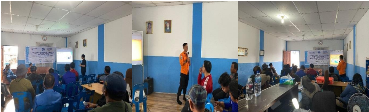
Figur 6. Sosialisasi Pentingnya Menggunakan Smart Life Jacket dan Penjelasan Tentang Teknik Pertolongan di Air

Tim pelaksana memberikan Sosialisasi dan bimbingan teknis penggunaan smart life jacket dalam meningkatkan keselamatan pelayaran Persatuan Pengemudi Motor Sangkut (PPMS) belakang padang Kegiatan ini bertujuan untuk diharapkan dapat mengurangi resiko terjadinya kecelakaan yang memakan korban jiwa.