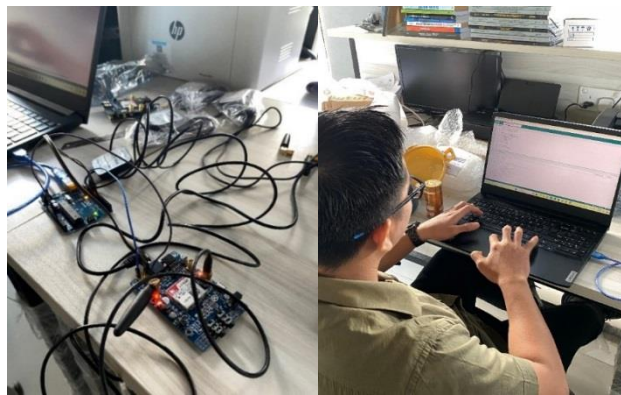
Figur 4. Proses Program Smart Life Jacket