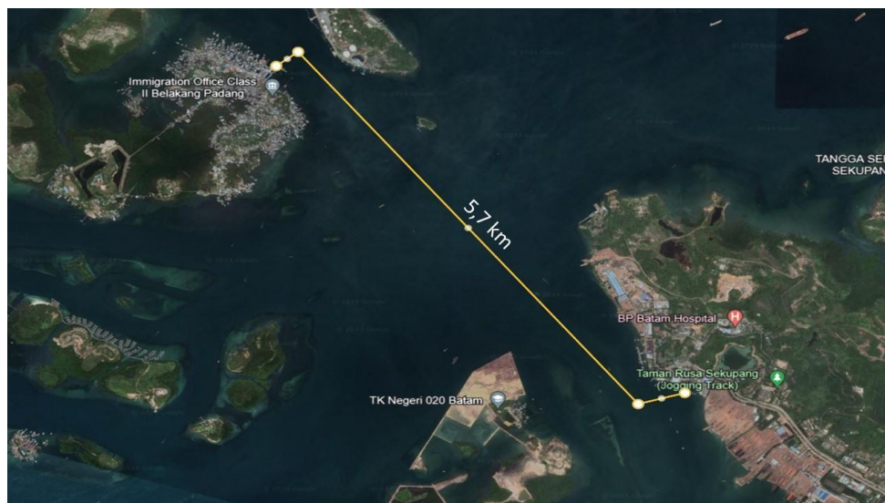
Figur 1. Jarak Pelayaran Dari Sekupang ke Belakang Padang