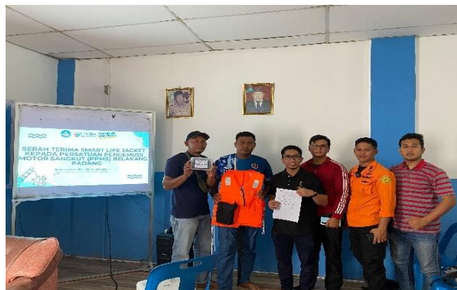
Figur 9. Penanda Tangan Berita Acara Serah Terima Smart Life Jacket

Tahap terakhir dari pelaksanaan kegiatan ini adalah evaluasi. Evaluasi dilakukan diakhir pertemuan dengan memberikan post test serta kuesioner kepada mitra penerima manfaat dari kegiatan ini yaitu PPMS. Post test dilakukan untuk mengetahui tingkat pemahaman peserta dilakukan sosialisasi pentingnya penggunaan smart life jacket . Kegiatan ditutup dengan penandatanganan berita acara serah terima alat smart life jacket dari tim pelaksana kepada ketua PPMS.