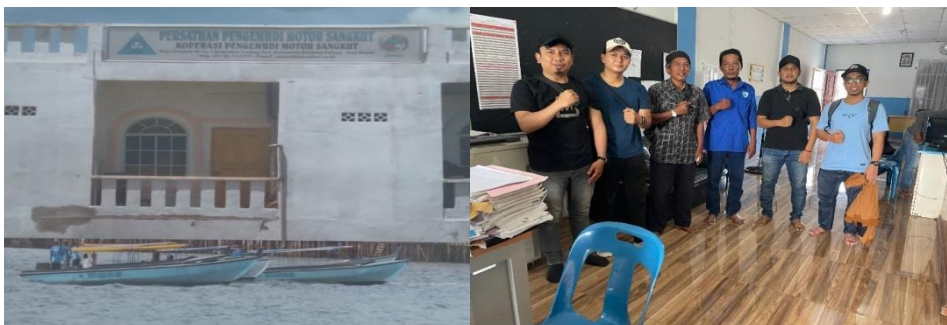
Figur 3. Pemaparan Maksud dan Tujuan kepada Ketua PPMS

Temuan permasalahan pada observasi awal ini kemudian disampaikan kepada Persatuan Pengemudi Motor Sangkut (PPMS).