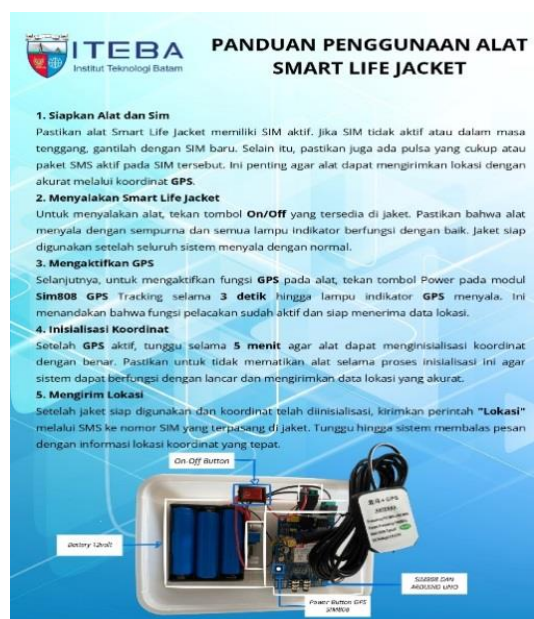
Figure 8. Buku Panduan Penggunaan dan Perawatan Smart Life Jacket

Untuk membantu dalam proses pemeliharaan, tim telah menyiapkan buku panduan mengenai penggunaan smart life jacket .