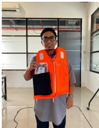
Figur 5. Smart life Jacket