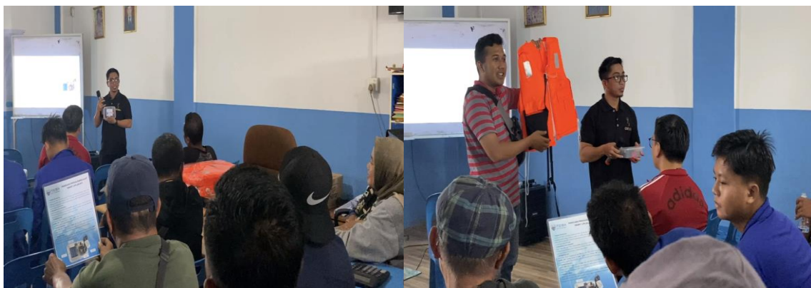
Figur 7. Pelatihan Proses Penggunaan Smart Life Jacket

Setelah jaket siap digunakan dan koordinat telah diinisialisasi, kirimkan perintah "Lokasi" melalui SMS ke nomor SIM yang terpasang di jaket. Tunggu hingga sistem membalas pesan dengan informasi lokasi koordinat yang tepat.