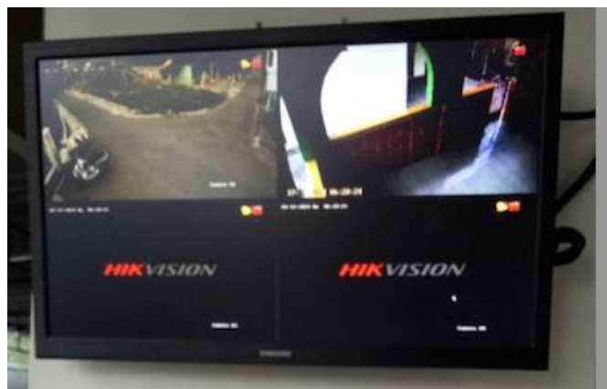
Figur 3. Pemasangan perangkat receiver (monitor) pada rumah salah satu rumah warga yang bersedia.

persimpangan yang biasanya padat lalu lintas dan Masjid setempat yang biasa menjadi tempat singgah masyarakat setempat dan juga pelintas. Pemasangan oleh pihak penyedia jasa pemasangan CCTV profesional dilakukan pada tanggal 22 Mei 2024 sebagaimana tercantum pada Figur 3. Keterlibatan pihak penyedia jasa pemasangan CCTV secara profesional ini bertujuan agar CCTV dapat terpasang dengan tepat dan berfungsi seperti yang diharapkan pada titik pasang yang disepakati bersama dengan RT/RW serta pihak-pihak terkait. Terjalannya komunikasi yang baik dengan para pemangku kepentingan dapat menjamin keberhasilan sebuah kegiatan PkM di tengah masyarakat (Kusuma et al., 2022).