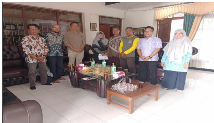
Figur 2. Rapat koordinasi antara tim PkM RG DIKE UNS dengan pihak-pihak terkait termasuk pengurus RT/RW setempat. Dalam kesempatan ini, beberapa titik pasang CCTV yang strategis telah diidentifikasi.

Pada tanggal 3 Mei 2024, tim PkM RG DIKE UNS bersama dengan RT/RW setempat serta pihak-pihak terkait melakukan koordinasi dan juga diskusi. Dalam koordinasi ini dilakukan identifikasi masalah dan pemetaan kondisi. Di samping itu, dengan adanya pengurus RT/RW serta pihak-pihak terkait dalam pertemuan tersebut, perencanaan kegiatan dan juga kegiatan koordinasi dapat dilakukan. Dalam pertemuan dan juga diskusi ini, tim PkM RG DIKE UNS, RT/RW, serta pihak-pihak terkait menyepakati solusi dari permasalahan yang berhasil diidentifikasi. Hasil akhir dari tahapan ini adalah kebutuhan CCTV, identifikasi titik pasang, dan rencana instalasi perangkat CCTV tersebut (Figur 2).