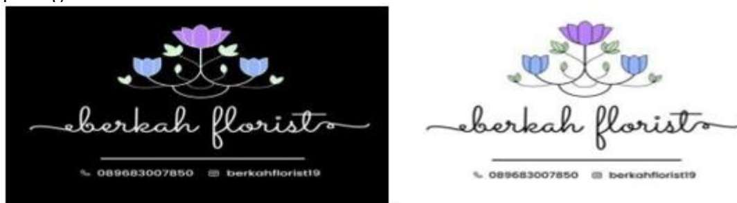
Gambar 3. Desain logo dalam background hitam dan putih

Berdasarkan kriteria desain yang telah didapatkan maka penulis merancang desain logo untuk CV Berkah Florist. Tampilan desain logo dan kemasan bisa dilihat pada gambar berikut: