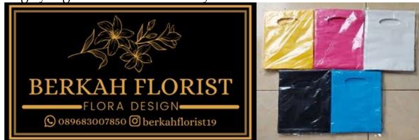
Gambar 1. Logo dan kemasan awal

ada bouquet bunga yang juga terdiri dari isian bunga, uang dan makanan serta yang lainnya sesuai permintaan konsumen. Selain itu ada pula bunga box dengan isian sesuai permintaan konsumen. Saat ini kemasan untuk packaging bunga menggunakan plastik Hd Plong dimana tidak dicantumkan merek toko dan untuk logo (brand merek) menggunakan kertas stiker ukuran 6x6 berwarna dominan hitam list kuning dengan font times new roman yg terdiri dari nama toko , instagram dan whatsApp serta simbol bunga yang menandakan sticker florist .