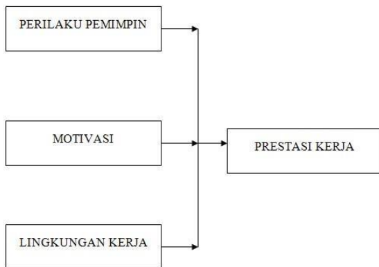
Gambar 1 Kerangka Konseptual Penelitian