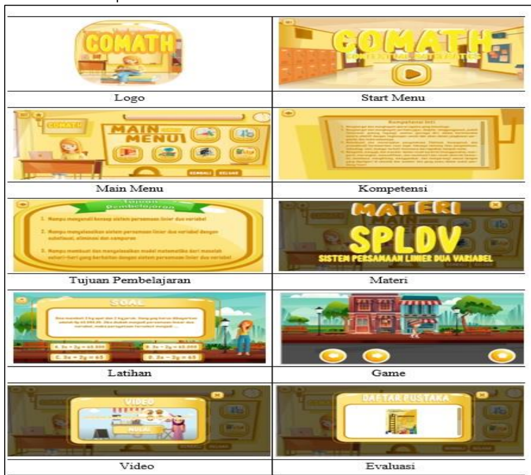
Gambar 2. Tampilan mockup media