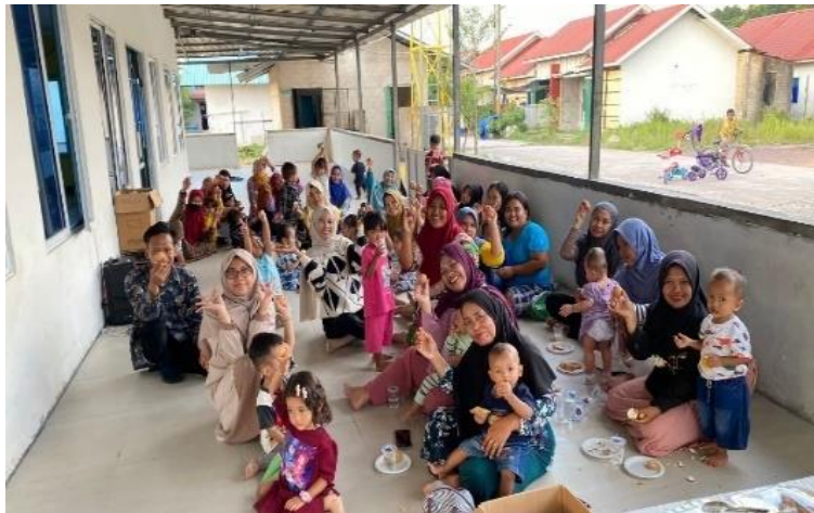
Figur 3. Advokasi kesehatan dan konseling kelompok

yang mudah dimengerti agar peserta mudah memahami. Dengan konseling kelompok ibu-ibu lebih mudah untuk berinteraksi tanpa ragu, saling mengutarakan isi hati, berbagi keresahan yang dialami dan lebih aktif bertanya untuk memperdalam pengetahuan tentang stunting dan pola asuh orang tua.