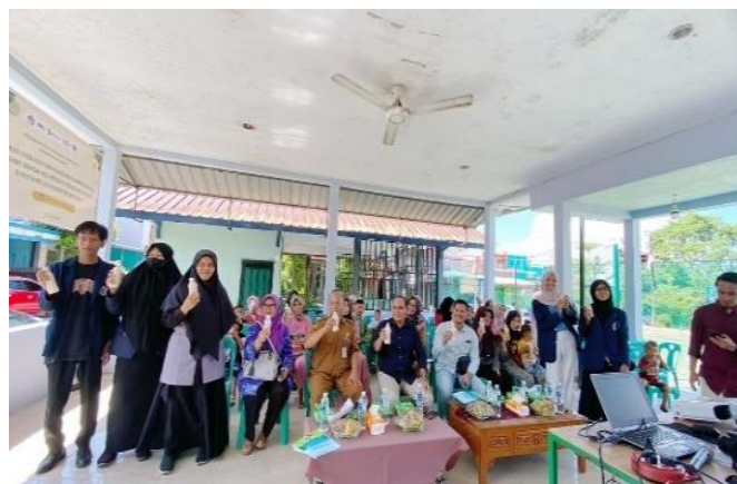
Figur 2. Peserta aktif berpartisipasi dan ikut serta dalam aksi minum soya bersama

Evaluasi dalam kegiatan dilakukan untuk mengetahui sejauh mana materi advokasi kesehatan dipahami dan diterima oleh peserta. Evaluasi dilakukan dengan melihat peserta yang hadir dan keaktifan selama proses konseling kelompok berlangsung secara luring sebanyak 6 kali pertemuan dalam rentang waktu 4 - 5 bulan. Kegiatan yang akan dilaksanakan selama 1-2 jam setiap satu kali pertemuan.