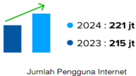
Gambar 1. Jumlah Pengguna Internet di Indonesia