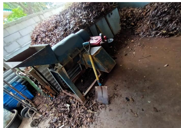
Gambar 3. Area Pengkomposan di Bank Sampah Unit X

Bank Sampah Unit X dikelola secara bersama oleh swadaya masyarakat, Dinas Pekerjaan Umum dan Dinas Lingkungan Hidup.