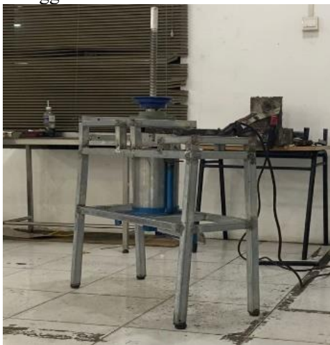
Gambar 6. Rangka Utama

Pasang rangka utama kaki bawah, tiang tengah, dan dudukan mesin dan dudukan bantalan jadi satu, kemudian dilas dengan menggunakan mesin las listrik