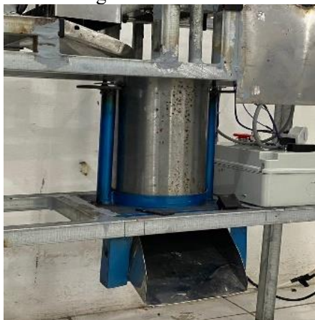
Gambar 7. Tabung silinder

Taruh tabung silinder pada pelat dudukan rangka utama.