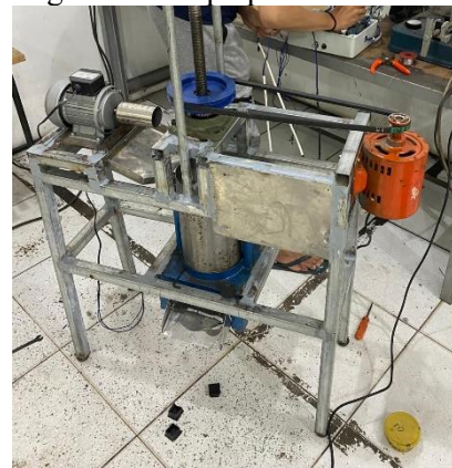
Gambar 9. hasil perakitan alat pres