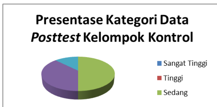
Gambar 4. Presentase Kategori Data Posttest Kelompok Kontrol