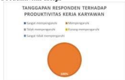
Gambar 7. Produktivitas Kerja Karyawan

Seluruh UMKM atau dengan persentase 100% pandemi Covid-19 mempengaruhi produktivitas kerja karyawan, karena banyaknya peraturan mengenai protokol kesehatan.