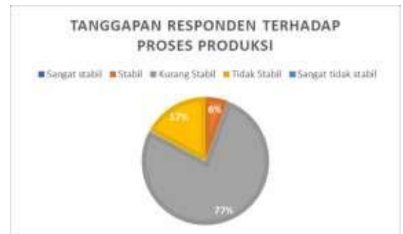
Gambar 4. Proses Produksi

Responden sebanyak 27 UMKM atau dengan persentase 77% menjawab kurang stabil atas.