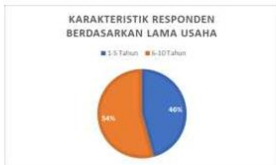
Gambar 2. Berdasarkan Lama Usaha

Responden UMKM lama usaha dagang 1-5 tahun sebanyak 16 UMKM dengan persentase sebanyak 46%, sedangkan dengan lama usaha 6-10 tahun adalah sebanyak 19 UMKM dengan tingkat persentase sebanyak 54%. Lama usaha responden UMKM terbanyak pada penelitian kali ini di Kelurahan Buliang adalah lama usaha 6-10 tahun sebanyak 19 UMKM.