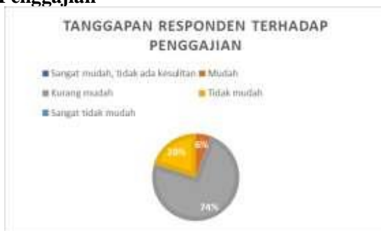
Gambar 5. Penggajian

Sebanyak 26 UMKM atau 74% kesulitan dalam menggaji karyawan. Responden menjelaskan alasannya karena penjualannya yang tidak stabi. 7 UMKM atau dengan persentase 20% masih mudah menggaji karyawan dan 2 UMKM atau dengan persentase 6% mampu menggaji karyawan.