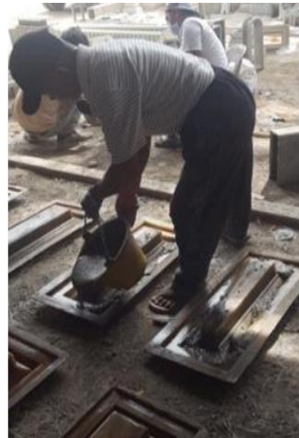
Gambar 1. Aktivitas pencetakan pilar

dan menumpahkannya semen seberat 5 kg dari dalam ember ke dalam cetakan, kemudian operator menaburkan pasir yang di pegang oleh salah satu tangannya seberat 2 kg untuk mempercepat proses pengeringan. Aktivitas tersebut dilakukan dengan postur janggal yaitu posisi tubuh operator membungkuk dengan membawa beban, jongkok dan aktivitas repetitive dalam waktu yang lama. Kondisi kerja tersebut menimbulkan keluhan rasa nyeri pada bagian leher, bahu, lengan, dan kaki setelah 8 jam operator bekerja setiap harinya, sehingga dikhawatirkan akan mempengaruhi kesehatan dan keselamatan kerja operator seperti gangguan musculoskeletal (otot, sendi serta tulang belakang). Dokumentasi postur kerja dilakukan pada saat operator melakukan aktivitas pencetakan yang dapat dilihat pada Gambar 1.