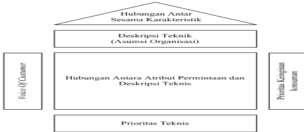
Gambar 1 House Of Quality

Dalam menggunakan matriks House Of Quality harus melalui proses-proses sebagai berikut: